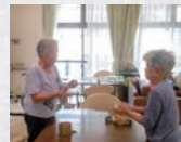
ストレス発散！ 楽しい！