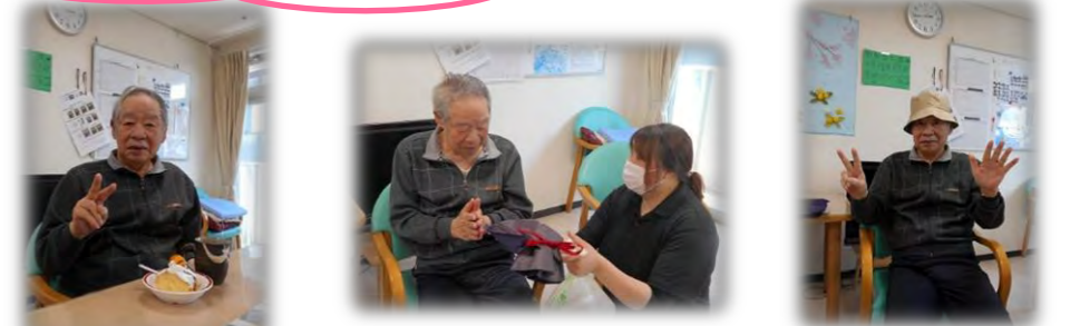
プレゼントは帽子です。お出かけするのが楽しみです(^-^)