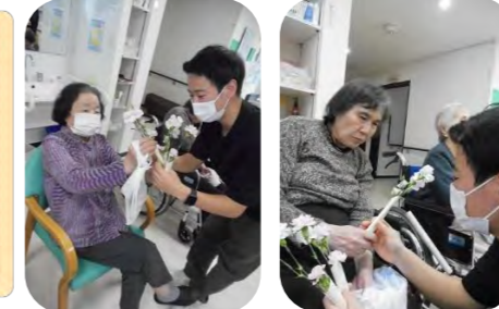
フルーツやクリームがたくさんのもっていて、おいしかったですね♪