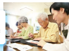
掃除をしたり、 散歩や買い物、 ゲームなど好きな ことを楽しみます