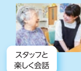
スタッフと 楽しく会話

今までの家庭生活の流れを壊さないよう、主体性を持って生活をしていただくために「生活」を支えるお手伝いをします。