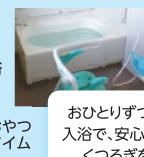
おひとりずつの 入浴で、安心した くつろぎを