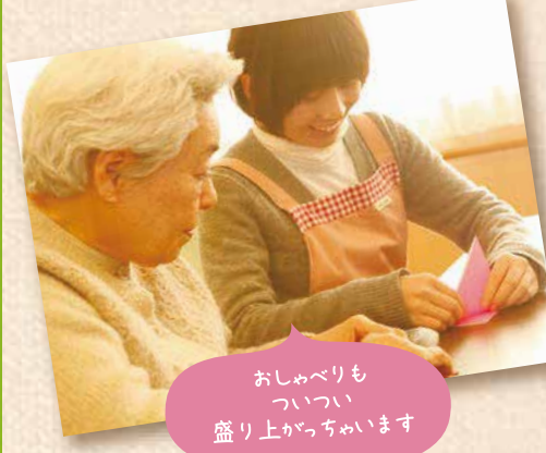
おしゃべりも つつい 盛り上がりちまいます