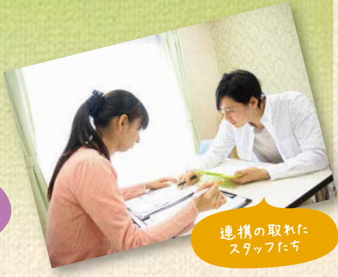
連携の取れた スタッフたち

グループホームってどんなサービス? 認知症を患っている方が、5~9人の少人数で生活をする共同住居です。認知症ケア専門の介護スタッフが、入居者さま一人ひとりに寄りそった介護を行い、心身の状態を穏やかに、普通の生活を過ごしていただける環境をつくっています。