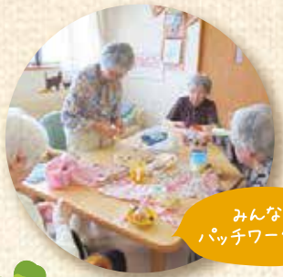
みんなで パッチワーク作り