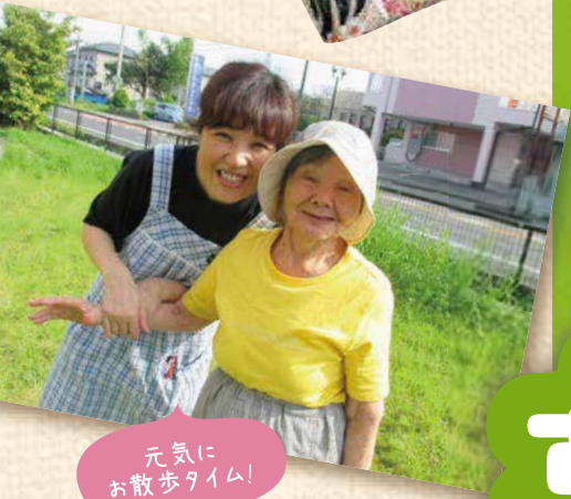
元気に お散歩タイム!