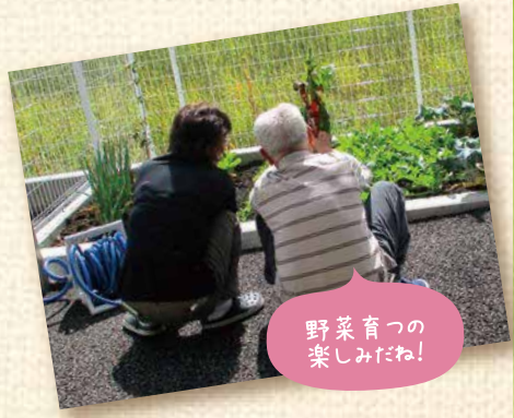
野菜育つの 楽しみだね!