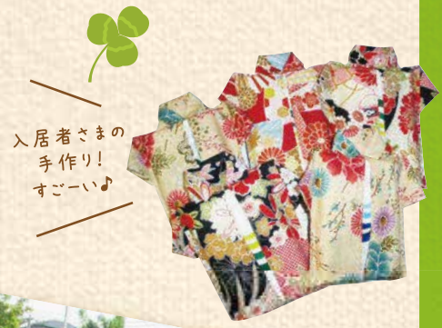
入居者さまの 手作り! すごーい♪