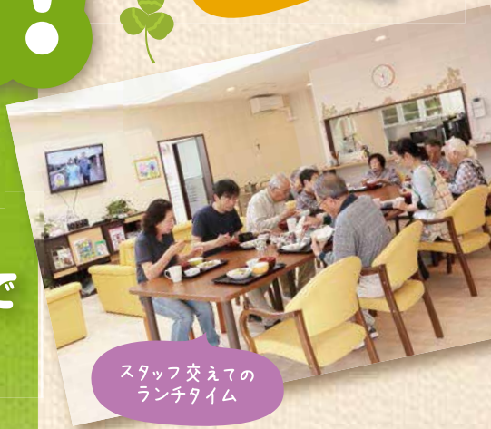
スタッフ交えての ランチタイム