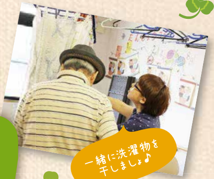
一緒に洗濯物を 干しましょ♪