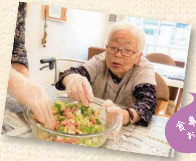
食卓の準備を お手伝い♪