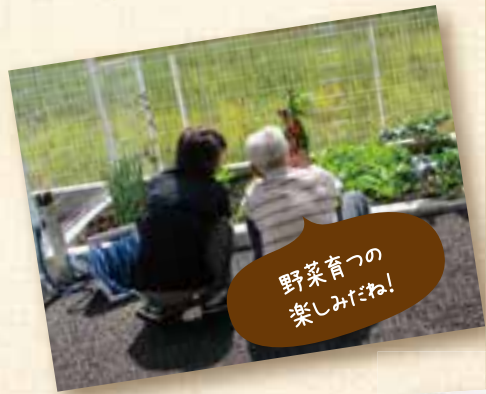
野菜育つの楽しみだね!