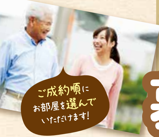
ご成約頃にお部屋を選んでいただきます!