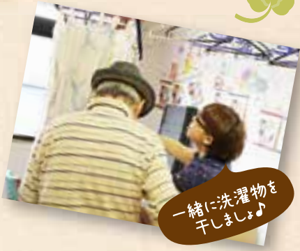
一緒に洗濯物を干しましょ♪