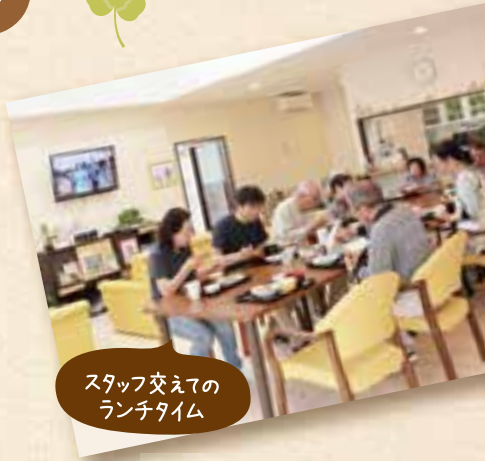
スタッフ交えてのランチタイム