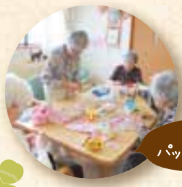
みんなでパッチワーク作り

認知症を患っている方が、5~9人の少人数で生活をする共同住居です。認知症ケア専門の介護スタッフが、入居者さま一人ひとりに寄りそった介護を行い、心身の状態を穏やかに、普通の生活を過ごしていただける環境をつくっています。