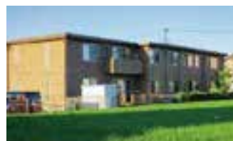
愛の家グループホーム 越谷相模