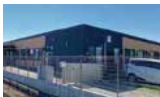
愛の家グループホーム 越谷平方