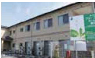
愛の家グループホーム 越谷