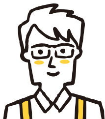
元他社介護施設職員