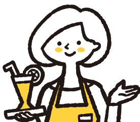
元レストラン店員