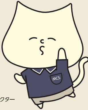
MCS公式キャラクター「ムーチョ」