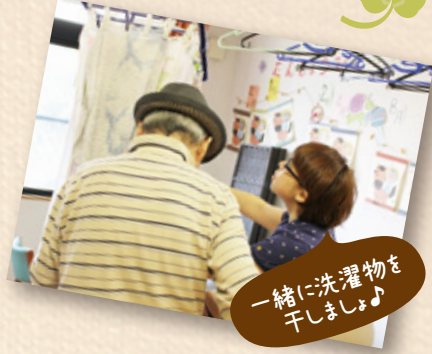
一緒に洗濯物を 干しましょ♪