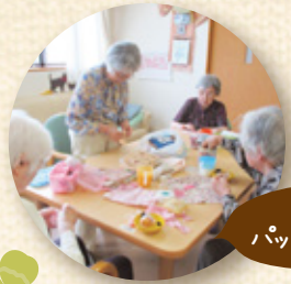
みんなで パッチワーク作り