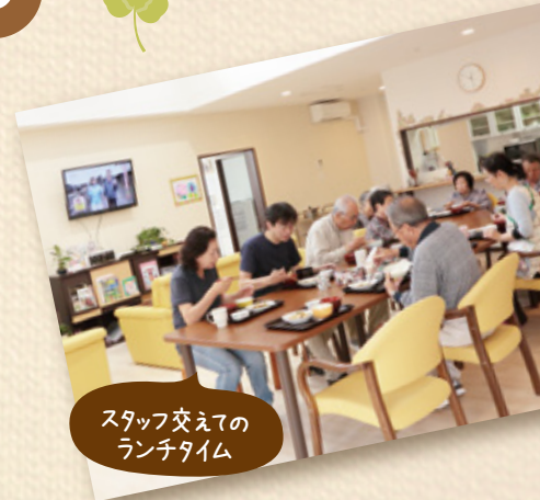
スタッフ交えての ランチタイム