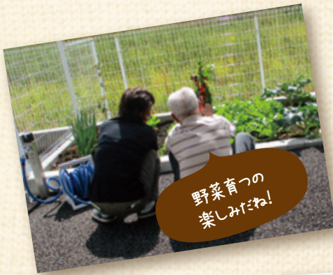
野菜育つの 楽しみだね!