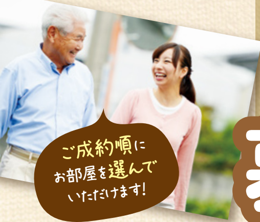
ご成約順に お部屋を選んで いただけます!