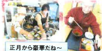
正月から豪華だね～