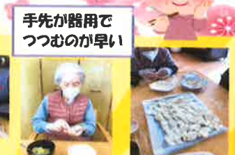
手先が器用で つつむのが早い