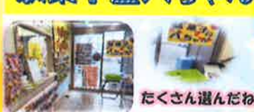
たくさん選んだね