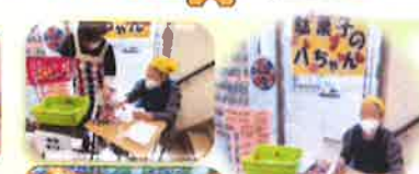
いらっやい いらっやい