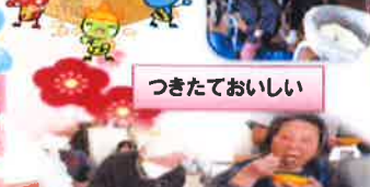
つきたておいしい