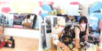
必死に詰めています