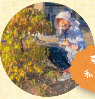
草取りは 私にお任せ!