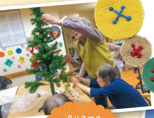
クリスマス 待ち遠しいねえ