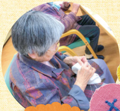
お裁縫だって 手が覚えているわよ