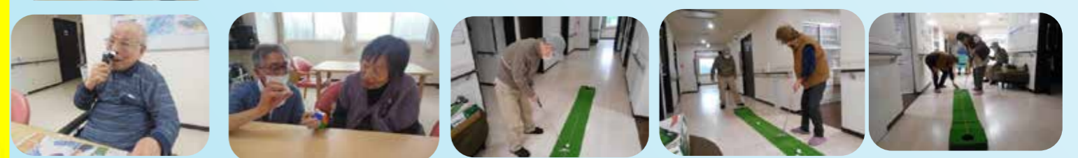
今回は女性もパターゴルフに挑戦中(^^)v