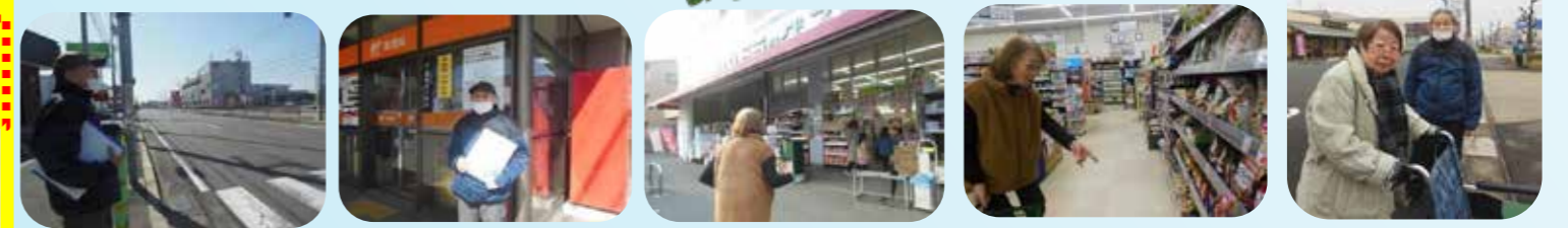
散歩がてら近くの郵便局まで郵便を出しに(^^)