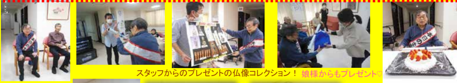
スタッフからのプレゼントの仏像コレクション！ 娘様からもプレゼント

続いてはT様。以前お住まいだった、滋賀県のお寺の名所トップ3の映像をみなさんと鑑賞しました。ここはこうだよと色々とお話してください、とても楽しい鑑賞会になりました。またプレゼントは仏像もお好きと伺ったので、滋賀県の有名な仏像を印刷したものをプレゼント。とても喜んでくださり、お部屋に飾ってあります。また、画廊を経営していたことあるとのことで、その時の絵画も飾り、当時の画廊を思い出していただきました(*^^*)