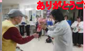
最後にお礼の花束を贈呈！