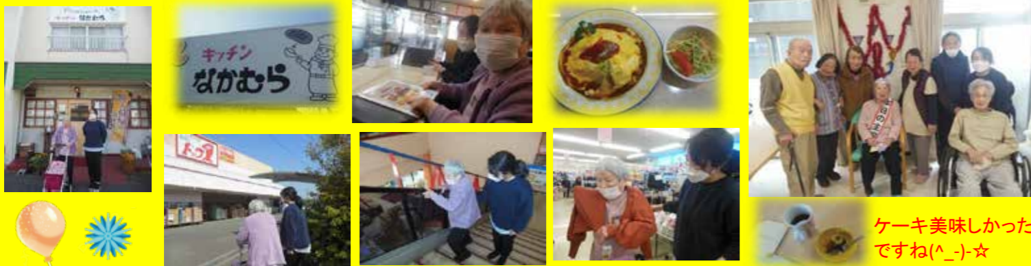
ケーキ美味しかったですね(^^)☆

N様は「オムライスが食べたい」とリクエストがあったので、老舗(?)の洋食屋さんへ行きました。美味しいオムライスを食べた後はお買い物へ♪カーディガンとお饅頭を購入しました(^^)ホームへ帰ると2階の皆様がお祝いしてくださいました。