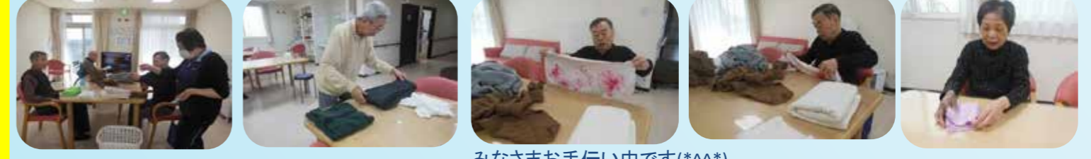
みなさまお手伝い中です(*^^*)