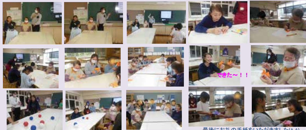
最後にお礼の手紙をいただきました(^^)

利用者様と一緒に、近所の小学校で認知症サポート養成講座を開催してきました。認知症について初めて学ぶ小学生でしたが、真剣に話を聞いて、理解してくれました。その後はみんなで認知症サポートマスコットのロボ隊長をフェルトで作りました！最後にポッチャというボール遊びをして大変盛り上がりました。短い時間でしたが、とても有意義な時間を過ごせました。