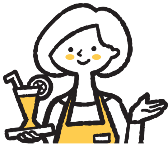
元レストラン店員