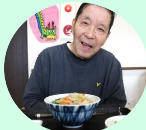
10月24日(木) 肉うどん インゲンの ゴマ和え 卵豆腐