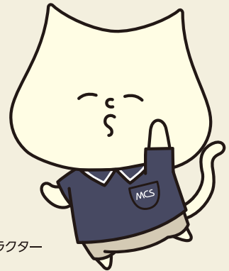
MCS公式キャラクター 「ムーチョ」