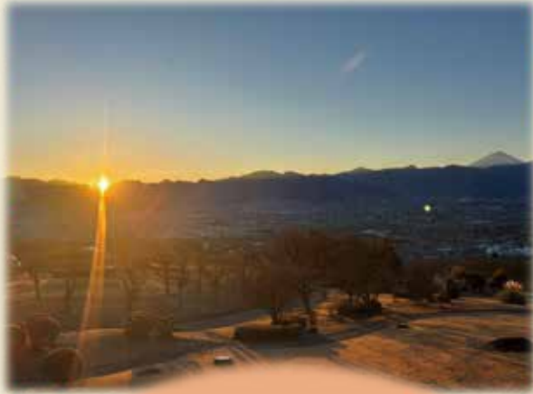
笛吹フルーツ公園より