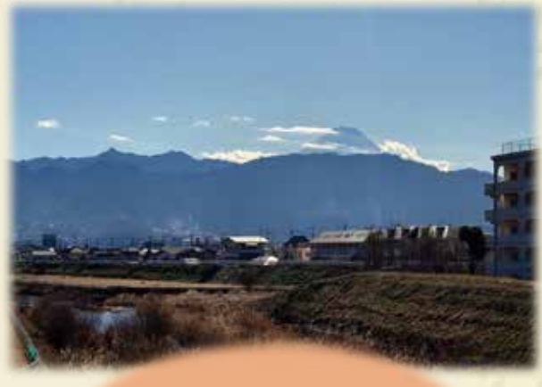
甲府市 荒川橋より

富士山は色々な所から見るができますよね いざ、見比べてみると色々な表情があるのも 富士山の魅力の一つ♪