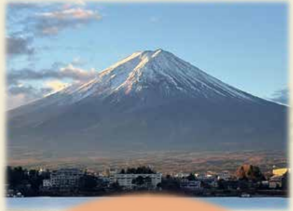
河口湖の湖畔より①