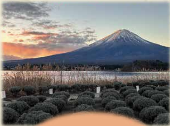
河口湖の湖畔より②