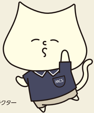
MCS公式キャラクター「ムーチョ」