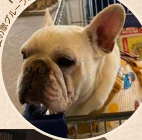
ドンちゃん 愛の家グループホーム白井富士の看板犬

『愛の家の介護のおしごと』 僕のいる「あいのいえ」では、おじいさん、おばあさんたちが協力しあって暮らしています。 おじいさんが「困ったな〜」というときは、そっと気付いて、解決してくれるスタッフさんがいます。 スタッフさんが「困ったな〜」というときは、おばあさんが「こうするのよ」と優しく教えてくれて、 お手伝いしてくれます。もちろん、みんな僕にもとっても優しくしてくれる人ばかり。 みんなみんな僕の大好きな人達です。