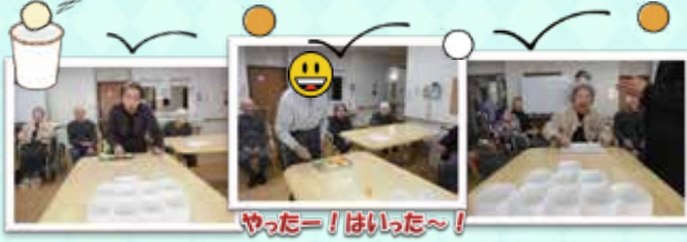
やったー！はいった～！

テーブルの上でピンポン玉をポンポンと弾ませて並べたカップに入れるゲームです。最初はなかなかうまくカップインできず苦戦していましたが、弾ませ方を工夫してどんどんカップインするようになり、みなさまゲームに夢中！笑顔いっぱいでした！